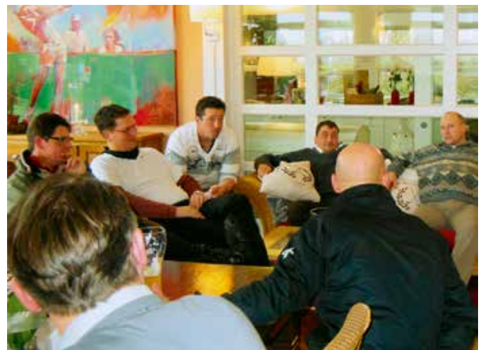
Relaxen nach der Runde

Besuchen Sie unsere Clubseiten auf www.golfclub-hohwacht.de